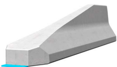
Elément de terminaison REBLOC 80X_4T (inclinaison 1:5)